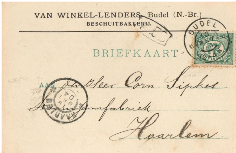
Briefkaart van Budel naar Haarlem van 18 maart 1904. Stempels:

Grootrondstempel van Budel en Haarlem. Tarief: 2½ cent. Briefkaart interlokaal volgens de tarieflijst van 1 april 1892.