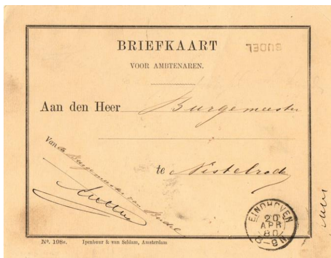
Briefkaart van Budel via Eindhoven en 's - Hertogenbosch naar Nistelrooy van 20 april 1880. Stempels: Naamstempel met Grotteske letters van Budel (rechtsboven kopstaand). Kleinrondstempel van Eindhoven en op de achterzijde het Kleinrondstempel van 's- Hertogenbosch. Tarief: Portvrijdom.