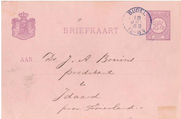
Briefkaart van Budel naar Idaard (Friesland) van 18 juli 1889. Stempels: Kleinrondstempel van Budel in de kleur Blauw . Tarief: 2½ cent. Briefkaart interlokaal volgens de tarieflijst van 15 maart 1882.