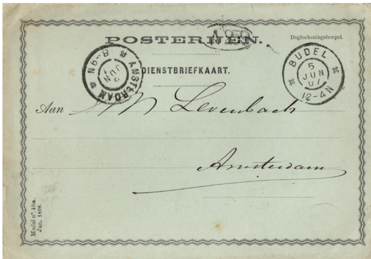
Briefkaart van Budel naar Amsterdam van 5 juni 1907. Stempels: Grootrondstempel van Budel en Amsterdam. Tarief: Portvrijdom.

Grootrondstempel van Budel en Haarlem. Tarief: 2½ cent. Briefkaart interlokaal volgens de tarieflijst van 1 april 1892.