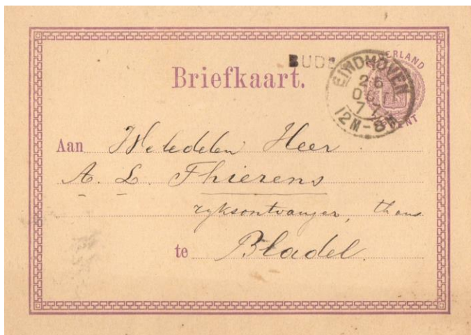
Briefkaart van Budel via Eindhoven naar Bladel van 26 oktober 1877. Stempels: Naamstempel met Grotteske letters van Budel. Tweeletterstempel van Eindhoven. Tarief: 2½ cent. Briefkaart interlokaal volgens de tarieflijst van 1 januari 1872.