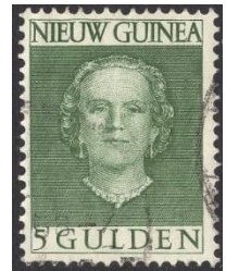
Nederlands Nieuw Guinea no 21