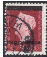
Indonesie no 356

Op 30 augustus 1948 verschenen in Nederland, Curacao en Suriname twee postzegels aan het loket ter ere van haar vijftigjarig regeringsjubileum.