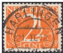
Nederland no 462

In 1946 verschenen in Nederland de eerste twee cijfzegels (1 cent rood en twee cent blauw) uit een serie van negen postzegels. Een jaar later werd de serie uitgebreid met de 2½ cent oranje. De andere waardes verschenen pas in de jaren vijftig. Suriname volgde in 1948, Nederlands Nieuw Guinea en de Nederlandse Antillen in 1950. Bij deze series waarin Jan van Krimpen de decoratieve vrijheid kreeg voor het ontwerp komt duidelijk de kalligrafie hem naar boven. Je ziet dan de zwierigheid in combinatie en fijn genanceerde letters en cijfers.