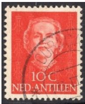
Nederlandse Antillen no 220

Dat de samenwerking goed in de smaak viel bewijst wel dat er in 1949 een geheel nieuwe frankeerserie op de markt kwam voor Nederland en zijn overzeese gebiedsdelen die we kennen als Juliana "Face". Deze serie werd in twee verschillende formaten uitgegeven. de kleine postzegels met waardes in centen en de grote in guldens.