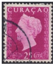
Curacao no 191