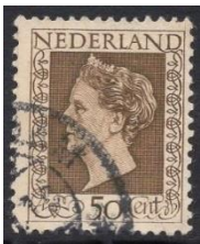
Nederland no 488

De afbeelding van de jubileum postzegels van koningin Wilhelmina is hetzelfde als die van de frankeerzegels die in 1948 aan het loket kwamen. Deze serie bestond in Nederland uit 13 verschillende postzegels van vijf tot vijftig cent en drie postzegels die voorzien waren van een gewijzigd kader. In Nederlands indie kwamen tien postzegels uit met deze afbeelding waarvan de drie hoogste waardes een groter formaat hadden. Een jaar later werden ze opnieuw uitgegeven met de opdruk Indonesia. Curacao gaf maar 10 postzegels uit en Suriname maar liefst 17.