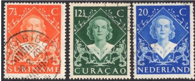
Suriname no 276 Curacao no 199 Nederland no 507

Een week later op zeven september 1948 kwam er weer een gezamenlijke uitgifte van bovengenoemde landen en Nederlands Indie in omloop. De inhoudigste postzegels van koningin Juliana.