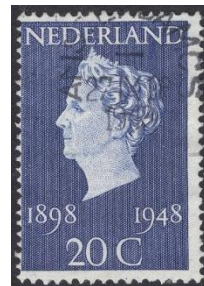
Nederland no 505

Op 30 augustus 1948 verschenen in Nederland, Curacao en Suriname twee postzegels aan het loket ter ere van haar vijftigjarig regeringsjubileum.