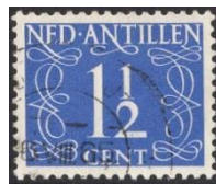
Nederlandse Antillen no 212