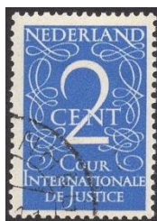
In Nederland werd er in 1950 een tweetal dienstzegels uitgegeven in dezelfde stijl. No D25

Vanaf 1947 kwamen er voor alle overzeese rijkdelen een nieuwe portserie op de markt. In Nederland waren dit zevenentwintig verschillende waardes waarvan vijfentwintig exemplaren in blauw en twee in rood, De