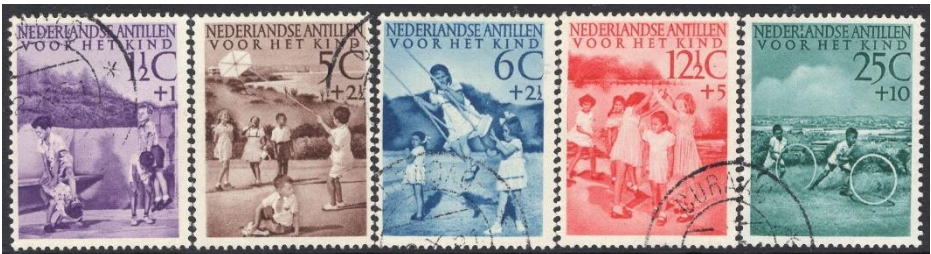
Nederlandse Antillen no 234/238